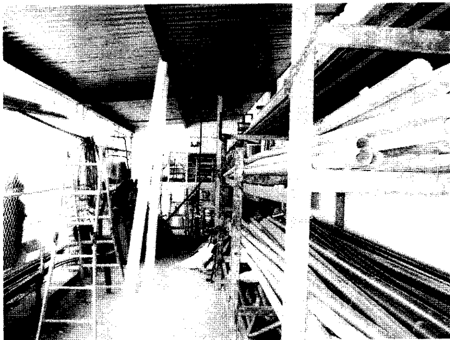
IMAGEN ALMACEN 2 SERVICIOS GENERALES