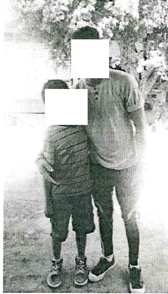
con su hermano menor