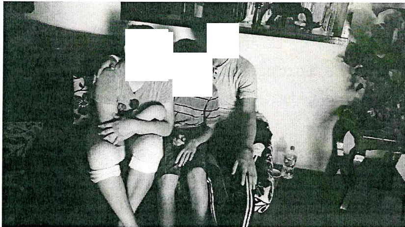
en la sala del domicilio de su tía