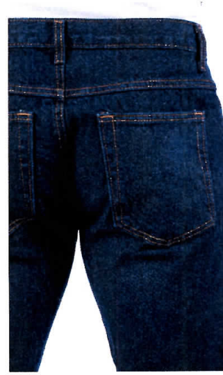
Pantalón en mezclilla color índigo Tipo vaquero suavizado normal Bolsas traseras en la parte superior izquierda y derecha