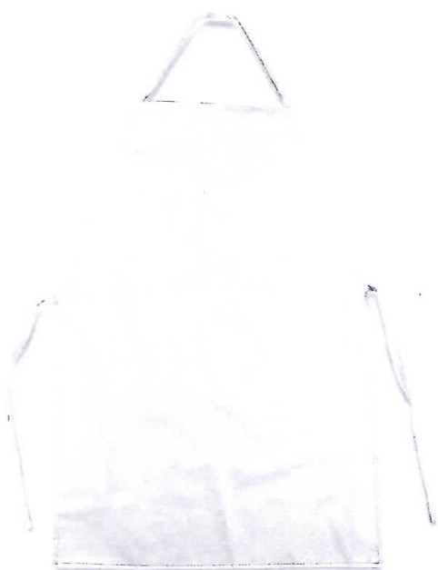
Mandil de plástico color blanco