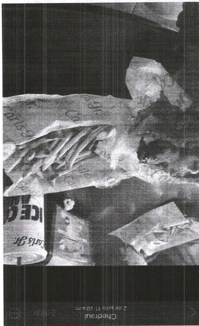
Chedraui 2 de julio 11:50 am

DECLARACION DE LA AUTORIDAD LOCAL EN MATERIA DE SALUD PUBLICA