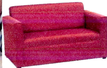
MILAN 2 plazas