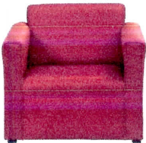
PARTIDA # 6