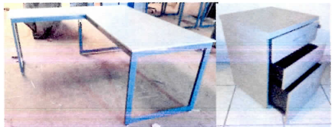
PARTIDA # 12